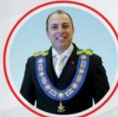
Arlindo Chapetta Secretário-Geral de Comunicação e Informática do GOB