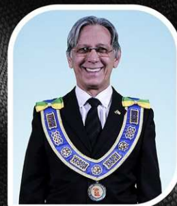
ARQUIARIANO BITES Presidente da SAFL