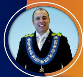
Arlindo Chapetta Secretário-Geral de Comunicação e Informática