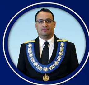
Leonardo Augusto Secretário-Geral de Educação e Cultura