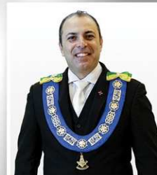
Arlindo Chapetta Secretário-Geral de Comunicação e Informática