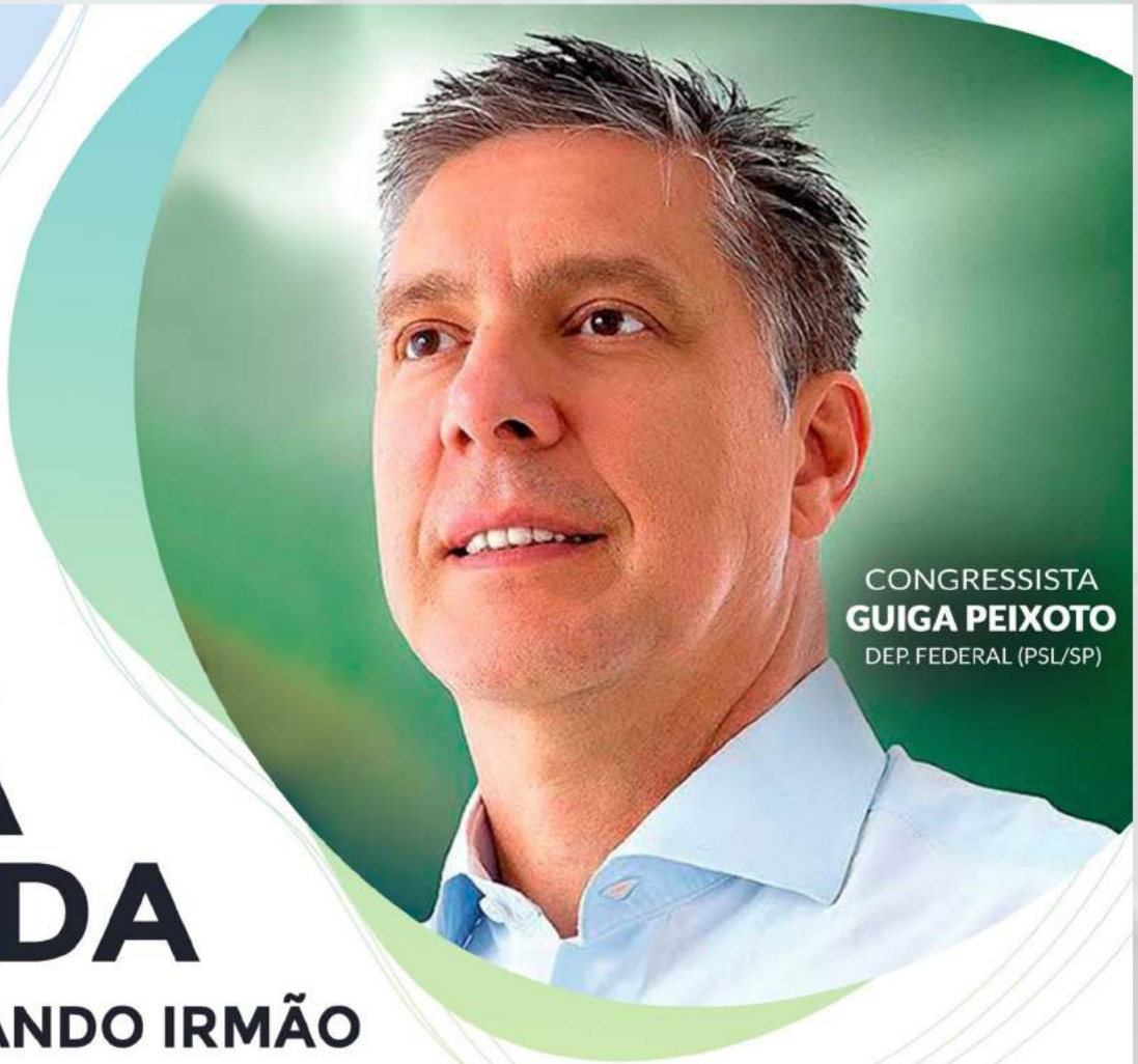
CONGRESSISTA GUIGA PEIXOTO DEP. FEDERAL (PSL/SP)

"BRASIL EM DESTAQUE ATRAVÉS DA VISÃO DO PARLAMENTO FEDERAL"