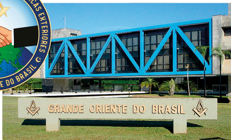
SEDE DO PODER CENTRAL - BRASÍLIA, DF.

A COMPETÊNCIA PARA A CONDUÇÃO DAS RELAÇÕES EXTERIORES NO GOB É PRIVATIVA DO PODER CENTRAL, POR INTERMÉDIO DO GRÃO-MESTRE GERAL, QUE A EXERCE ATRAVÉS DESTA SECRETARIA GERAL.