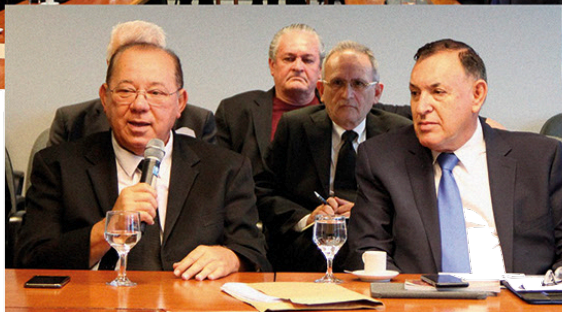
25ª ASSEMBLÉIA GERAL DA CMI, MARÇO DE 2020, GOB - BRASÍLIA - DF

DESTACA-SE AINDA A REDE DE GRANDES REPRESENTANTES, TANTO OS DO GOB JUNTO ÀS OBEDIÊNCIAS MAÇÔNICAS RECONHECIDAS NO EXTERIOR, COMO OS DESTAS OBEDIÊNCIAS, JUNTO AO GOB, POSSUINDO ATRIBUIÇÕES ANÁLOGAS ÀS DE DIPLOMATAS, CUJO OBJETIVO É APRIMORAR AS RELAÇÕES FRATERNAS ENTRE AS OBEDIÊNCIAS E AUXILIAR OS IRMÃOS NO TERRITÓRIO REPRESENTADO.