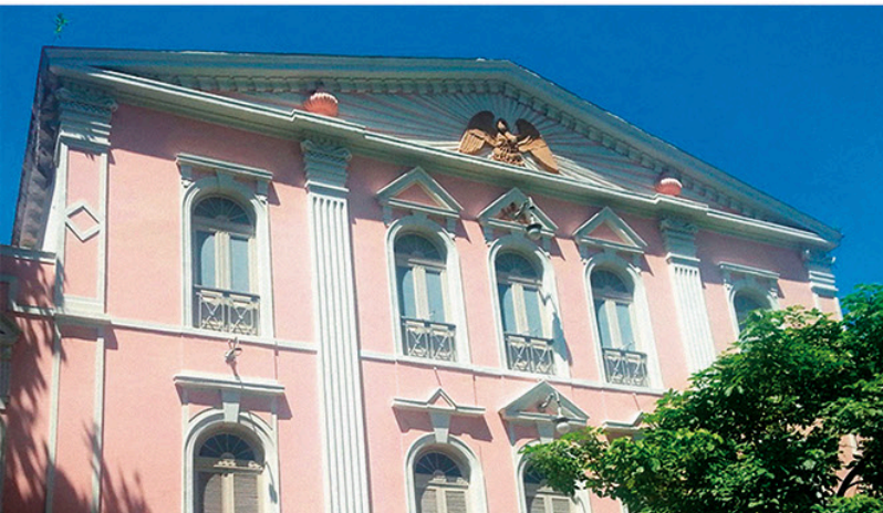
PALÁCIO DO LAVRADIO, RIO DE JANEIRO, RJ

AS INFORMAÇÕES ABAIXO, EXTRAÍDAS DE MATERIAL PRODUZIDO PELA SECRETARIA GERAL DE RELAÇÕES MAÇÔNICAS EXTERIORES DO GOB, PODERÃO SER UTILIZADAS PELO IRMÃO NAS SUAS VISITAS MAÇÔNICAS AO EXTERIOR E PARA A DIVULGAÇÃO INSTITUCIONAL DO GOB, POIS CONTÊM MUITOS DADOS ÚTEIS QUE PODERÃO INTERESSAR AOS IRMÃOS QUE VENHAM A CONHECER NAS SUAS VIAGENS INTERNACIONAIS.